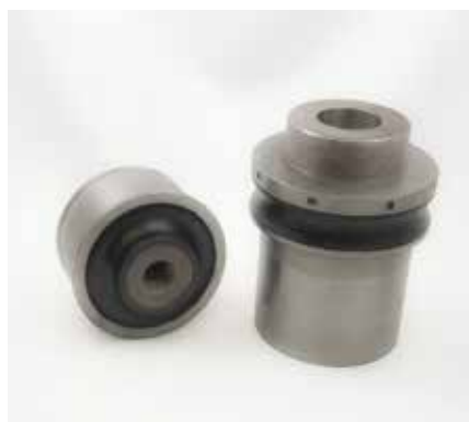
SUPPORTI MOTORI IN GOMMA METALLO