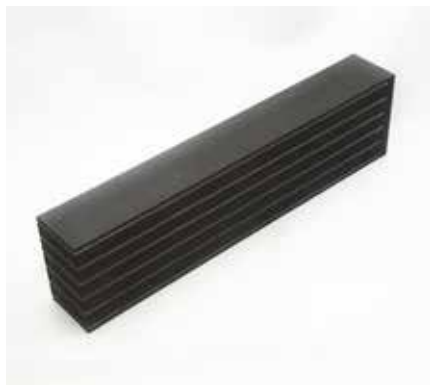
APPOGGIO IN GOMMA ARMATO PER ANTISISMICA