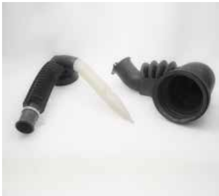
ARTICOLI PER ELETTRODOMESTICI