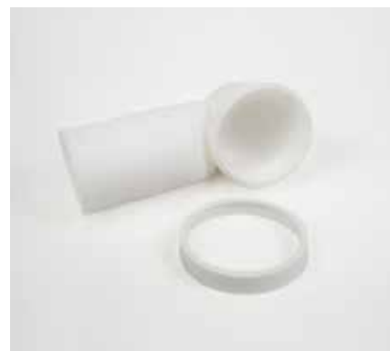
COMPONENTISTICA PER SANITARI