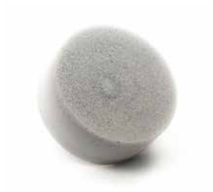
GUARNIZIONE IN MATERIALE ESPANSO