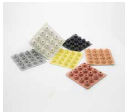
TASSELLI DI BATTUTA ADESIVIZZATI