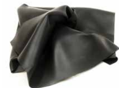
TESSUTO IN GOMMA