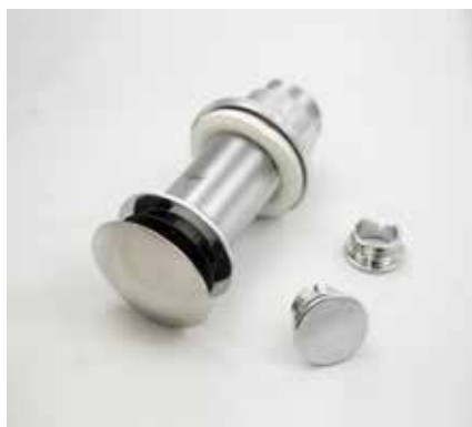
COMPONENTISTICA PER SANITARI