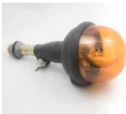
ELEMENTO PER SISTEMI DI ALLARME