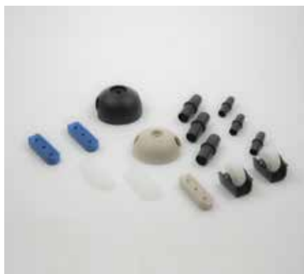
COMPONENTISTICA IN PLASTICA