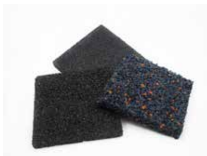
TAPPETI INSONORIZZANTI E ANTITRAUMA