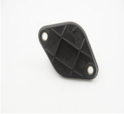
PRISE DE COURANT