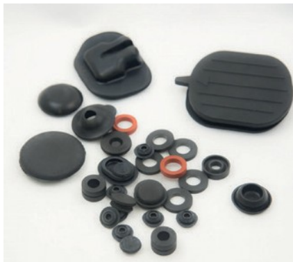
BOUCHONS DE TROU ET JOINTS