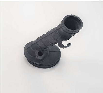
ÉLÉMENT EN CAOUTCHOUC FILTRE POUR MOTOS