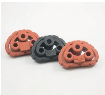
INSERTS POUR SUPPORT DE SILENCIEUX