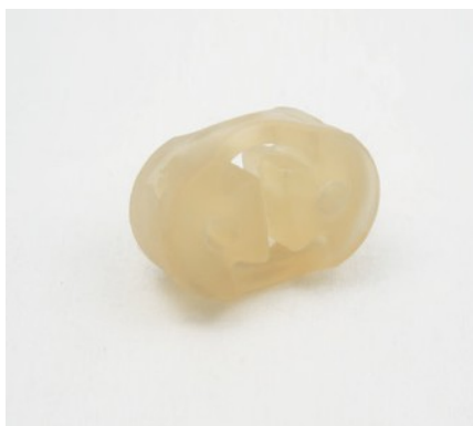
INSERT POUR SUPPORT DE SILENCIEUX