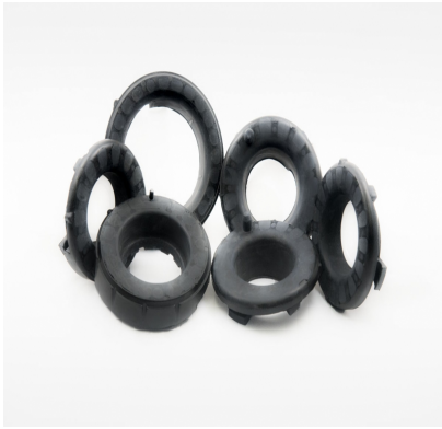
AMORTISSEMENTS DE VIBRATION POUR SYSTÈME DE SUSPENSION