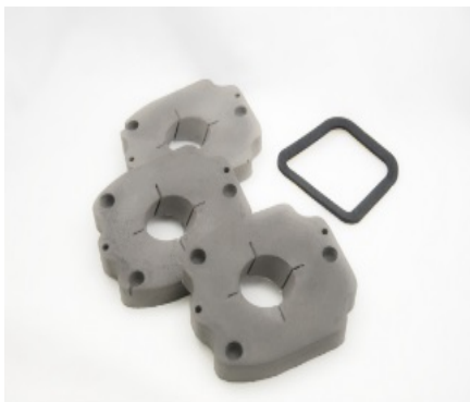
JOINTS EN MATÉRIAU EXPANSÉ