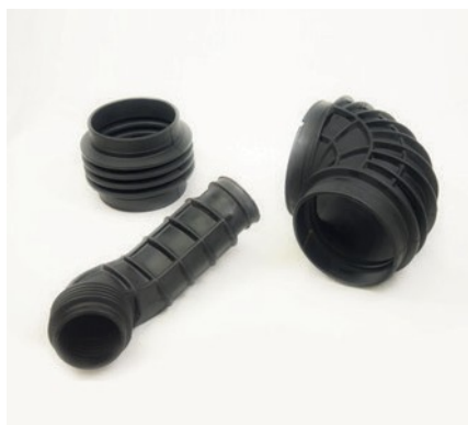
SOUFFLETS DE GRANDE DIMENSION POUR VÉHICULES INDUSTRIELS