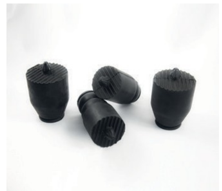
AMORTISSEMENTS DE VIBRATION POUR SYSTÈME DE SUSPENSION