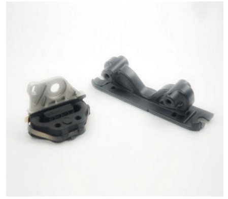
INSERTS POUR SUPPORT DE SILENCIEUX