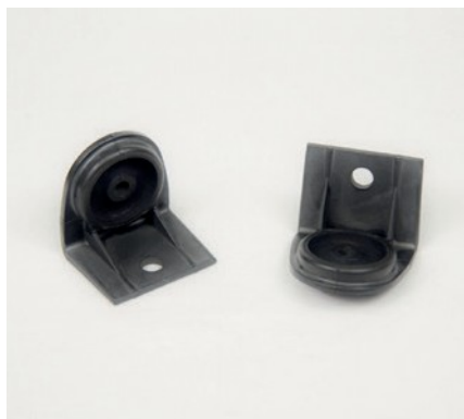
SUPPORTS DE RADIATEUR