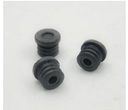
JOINTS POUR DIPSTICK D'HUILE