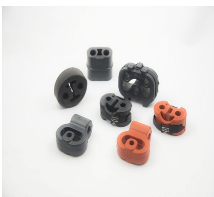
INSERTS POUR SUPPORT DE SILENCIEUX