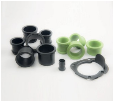
JOINTS DU SYSTÈME D'INJECTION DE CARBURANT