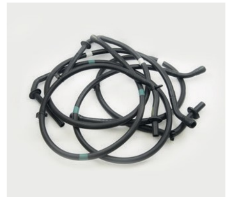
TUYAUX DE VIDANGE D'EAU ET RACCORDS