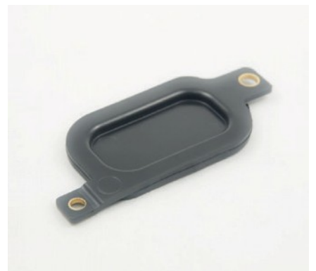
PRISE DE COURANT