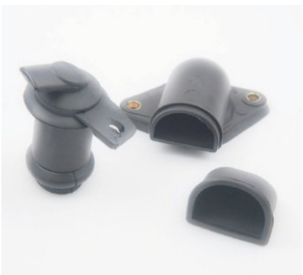
DRAINS DE CONDENSAT