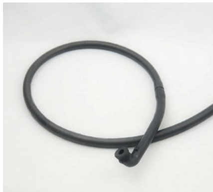
TUYAU DE VAPEUR DE CARBURANT ET RACCORD