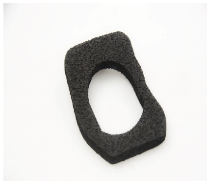
JOINTS EN MATÉRIAU EXPANSÉ