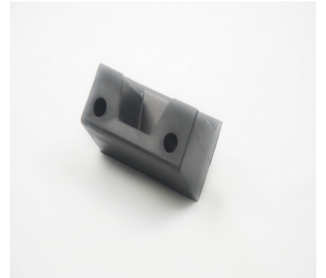
TAMPONS D'ARRÊT DE CAOUTCHOUC