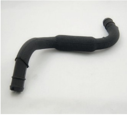
TUBE DE VAPEUR AVEC GAINÉ DE PROTECTION