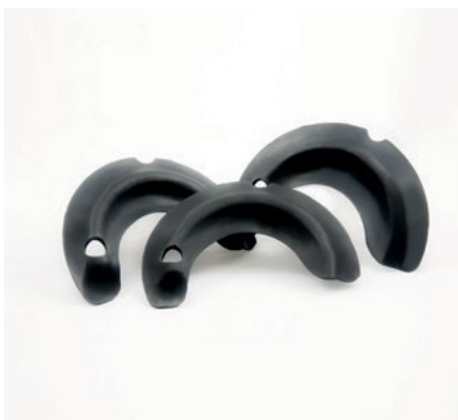
AMORTISSEMENTS DE VIBRATION POUR SYSTÈME DE SUSPENSION