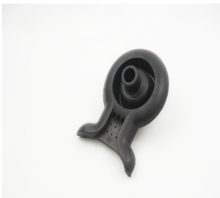
ARTICLE POUR LE CÂBLAGE