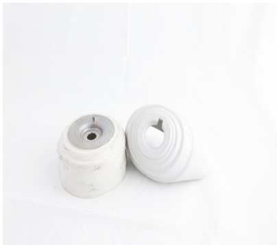
COUPE DE PROTECTION THERMIQUE