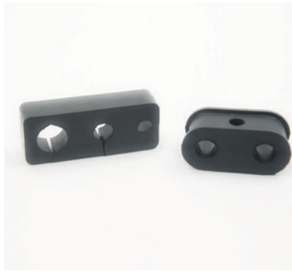
PROTECTION DES TUBES