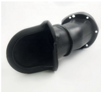
JOINT DE SYSTEME D'INJECTION DE CARBURANT