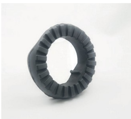
AMORTISSEMENTS DE VIBRATION POUR SYSTÈME DE SUSPENSION