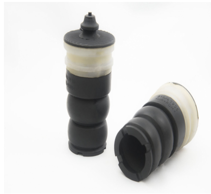
AMORTISSEMENTS DE VIBRATION POUR SYSTÈME DE SUSPENSION