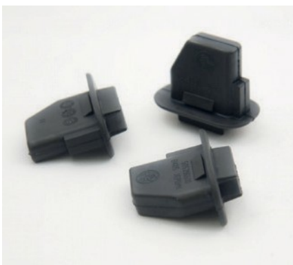
FIXATION DES ÉLÉMENTS DE CAOUTCHOUC