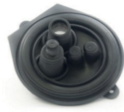
ARTICLE POUR LE CÂBLAGE