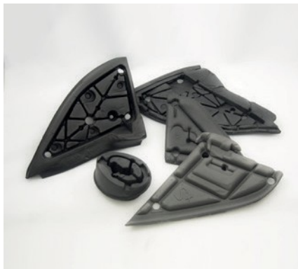
JOINTS POUR MIROIRS DE RÉTROVISEURS