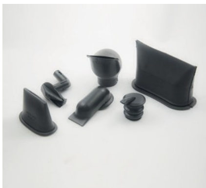
TUYAUX DE DRAINAGE DE CONDENSAT