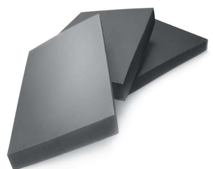
PLAQUE EN EPDM EXPANSÉ