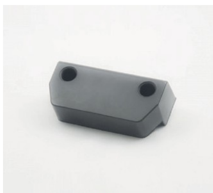
BUFFER DE PORTE