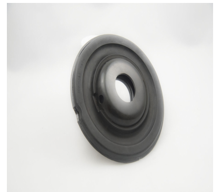
AMORTISSEMENT DE VIBRATION POUR SYSTÈME DE SUSPENSION