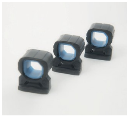
SUPPORTS DE RADIATEUR