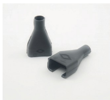
ARTICLES POUR LE CÂBLAGE