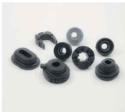
SUPPORTS DE RADIATEUR