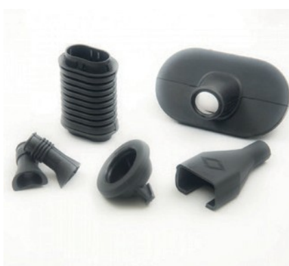
ARTICLES POUR LE CÂBLAGE